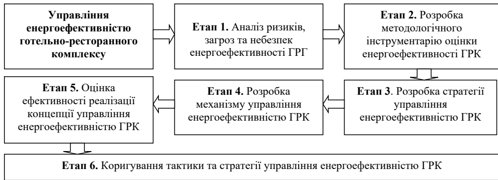
Рис. 1. Схема управління енергоефективністю готельно-ресторанного підприємства Fig. 1. Scheme of energy efficiency management of hotel and restaurant enterprise

нена в рамках другого етапу реалізації концепції. Зауважимо, на цьому етапі визначаються конкретні цілі щодо забезпечення енергоефективності, мета управління нею з урахуванням проблемних ситуацій, а також здійснюється постановка завдань, що сприятимуть досягненню мети концепції управління енергоефективністю та реалізації стратегії управління енергоефективністю готельно-ресторанного комплексу.