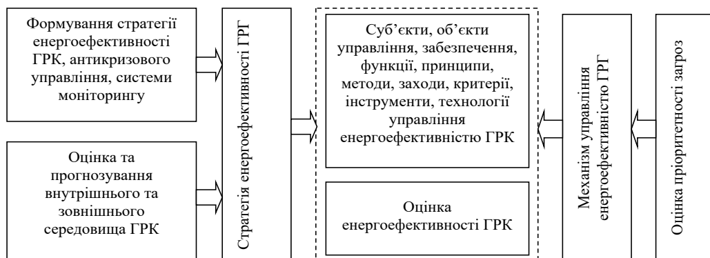
Рис. 2. Взаємозв'язок стратегії енергоефективності готельно-ресторанного комплексу та механізму її управління

Аналіз ряду наукових робіт (Амоша та ін., 2008; Барановська та ін., 2019; Берзіна та ін., 2017; Бобров, 2013; Валінкевич, 2018; Варналій та ін., 2011; Галасюк & Шикіна, 2015; Геєць та ін., 2006; Єрмаченко & Журавльова, 2015) показав, що основні завдання механізму управління енергоефективністю готельно-ресторанного комплексу (ГРК) мають тісний зв'язок зі стратегічними інтересами самого підприємства (рис. 2).