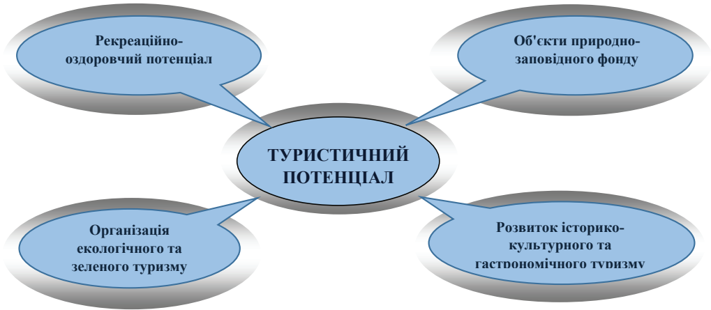
Рис. 1. Туристичний потенціал Миколаївської області